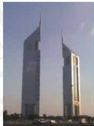
Emirates Towers Projects - Hotel Tower - DUBAI - U.A.E.

業務に携わる技術者は、検査・認証のワールドリーダーであるビューローベリタスの歴史と誇りを踏襲し、高度な専門知識と実務能力を備え、顧客志向に立ったソリューションをご提供します。