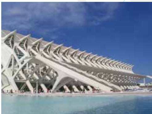
Science Musium. Principe Felipe - Valencia - SPAIN

ビューローベリタスは、建築部門として世界において唯一「IFIA」※に加盟、法律、規格、自主基準に準拠しているかどうかについて、第三者として、公正・公平・中立な立場で、建築物等に係る適合性評価・監査を行います。